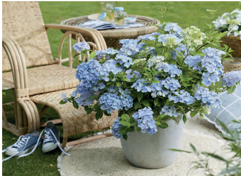
Neuerdings auch in Blau: Girlanden-Hortensien sind eine Neuzüchtung aus der bekannten Bauernhortensie, die entlang der gesamten Seitentriebe blühen.

Regelmäßig gießen & düngen Wegen ihres ausladenden Wuchses eignen sich Girlanden-Hortensien am besten für die Bepflanzung eines hohen Gefäßes. Hier kommen die etwa einen Meter langen Blütentriebe besonders gut zur Geltung. Aber auch im Beet macht das Ziergehölz eine sehr gute Figur. Der ideale Standort ist im Halbschatten. Wichtig für den Blüherfolg ist eine gute Versorgung: Das Ziergehölz benötigt wie die Bauernhortensien viel Wasser. Außer-