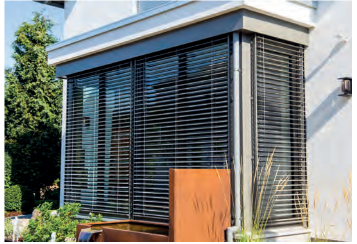
Sommerlicher Wärmeschutz: Gefördert wird ausschließlich außenliegender Sonnenschutz.

Gefördert wird ab einer Investitionssumme von 2.000 Euro brutto. Der Fördersatz beträgt