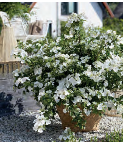
Ideal für Töpfe und Kübel: Wie ein Blumenstrauß wirkt die Girlanden-Hortensie. Die Triebe werden mit den Jahren immer länger und sollten nicht beschnitten werden.

Erst nach vier bis fünf Jahren an ihrem Standort empfehlen Experten einen Verjüngungsschnitt. Ansonsten beschränkt sich die Pflege darauf, kahl werdende Triebe zurückzuschneiden. (GMH/FGJ)