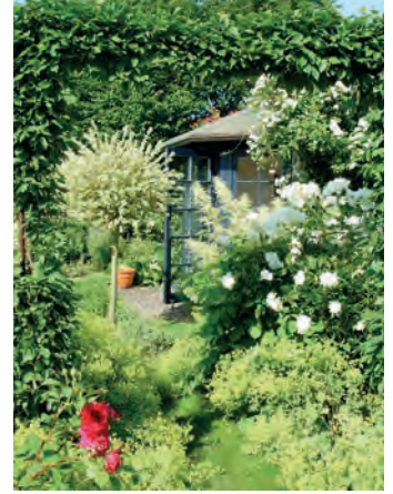
Lauschige Ecken, die nicht direkt einsehbar sind, bieten Möglichkeiten zum Rückzug nach einem hektischen Alltag.

„Rundbögen, Laubgänge, ein Pavillon oder auch ein mittig im Garten platzierter Baumsolitär bringen Höhe ins Gesamtbild, schützen vor Blicken von außen, schaffen Privatsphäre und einen