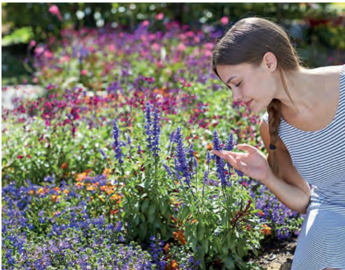
Blütenpracht auch ohne viel zu gießen: Zahlreiche Pflanzen gedeihen auch mit wenig Wasser. Bei der Auswahl von trockenheitsresistenten Arten und Sorten berät der gut sortierte Gartenfachhandel.