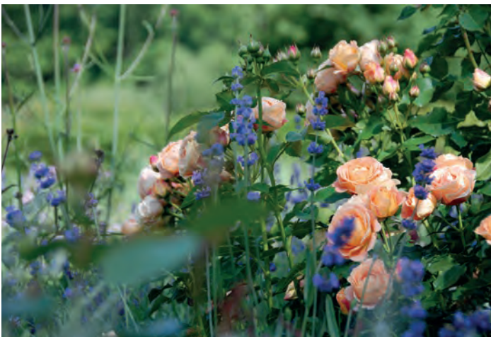
Blühende Rosen, duftender Lavendel - romantische Gärten laden zum Träumen und Entspannen ein.